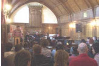
Oi Martin bertso-antzerkia